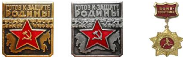
ЗОЛОТОЙ НАГРУДНЫЙ ЗНАК «ВОИН-СПОРТСМЕН», 1961 ГОД

В 1966 году по инициативе ДОСААФ была разработана и введена в действие ступень комплекса ГТО для молодежи призывного возраста «Готов к защите Родины» (ГЗР). Она была рассчитана на юношей допризывного возраста и включала выполнение ряда требований по спортивно-техническим видам спорта и овладение одной из военно-прикладных специальностей (моториста, шофера, мотоциклиста, радиста).