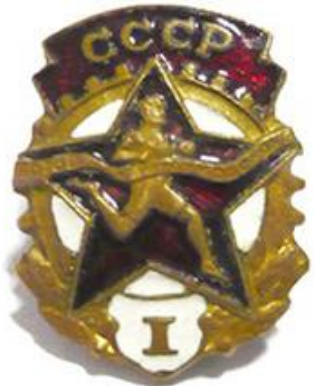
Значок «Будь готов к труду и обороне»