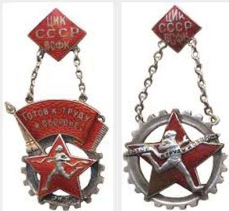
ЗНАЧКИ ГТО 1931-1936 ГОДОВ (I и II СТУПЕНЬ)