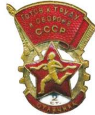
Значок «Отличник ГТО» 2 степени 1940-1946 годов (бронза)