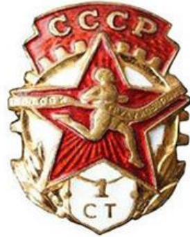
Значок «Отличник БГТО» 1940 год