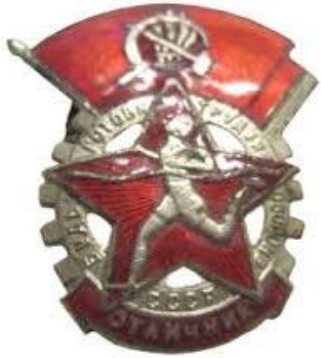
Значок ГТО 1 степени