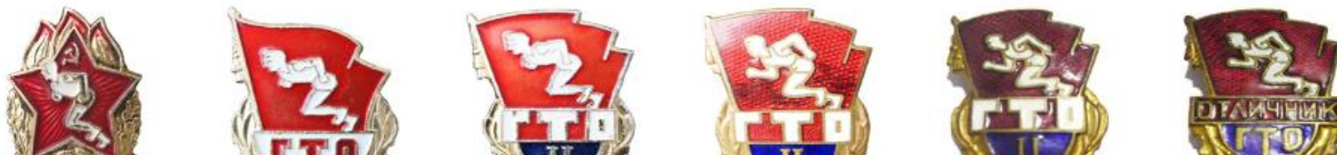
ЗНАЧКИ «ВОИН-СПОРТСМЕН» I, II И III СТУПЕНЕЙ, 1961 ГОД