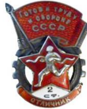
Значок «Отличник ГТО» 2 степени 1940-1946 годов (серебро)